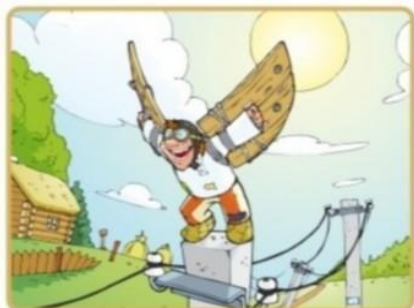
Не лезь на опоры и столбы

Чтобы не подвергать себя риску, запомните простые правила: