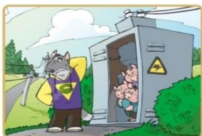
Не лезь на электроустановки и в трансформаторные будки

Опасно для жизни влезать на опоры линий электропередачи, проникать в трансформаторные подстанции или подвалы, где находятся электрические провода