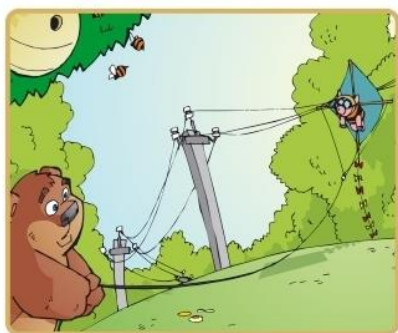
Не бросай ничего на провода и не играй вблизи

Никогда не заходите на территорию и в помещения электросетевых сооружений. Не открывайте двери ограждения электроустановок и не проникайте за ограждения и барьеры. Это может привести к печальным последствиям