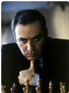
. Гарри Кимович Каспаров