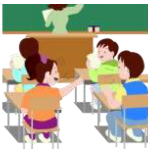
ГРАФИК ЗАНЯТОСТИ КАБИНЕТА № 307 В 1 СМЕНУ